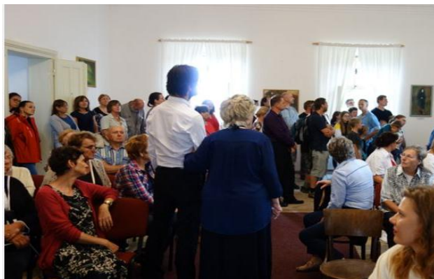
Foto z vernisáže